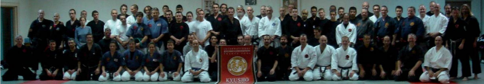
Foto de la inauguración de la Convención Internacional de Kyusho celebrada en Thonon les Bains.